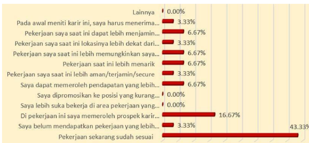
Grafik 2 Kesesuaian Pekerjaan dan Alasan Tetap Mengambil Pekerjaan Meskipun Belum Tidak Sesuai Dengan Bidang Pendidikan

Dengan adanya kesesuaian kompetensi yang dimiliki dengan bidang pekerjaan yang ditekuni pada saat ini menjadi dorongan bagi alumni untuk tetap menekuni pekerjaan yang telah ditekuni pada saat ini. Grafik..... berikut menyajikan fakta empirik yakni 43% alumni tetap pada pekerjaan yang ditekuni saat ini karena dianggap sudah sesuai. Kata sudah sesuai mempunyai makna kesesuaian antara kompetensi dan pengetahuan yang dimiliki dengan persyaratan pekerjaan yang ditekuni saat ini. Kecenderungan empirik ini mendukung terhadap kecenderungan empirik yang disajikan pada grafik di atas.