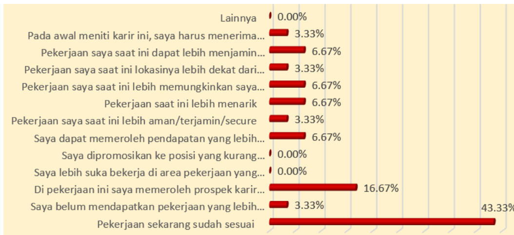
Grafik 2 Kesesuaian Pekerjaan dan Alasan Tetap Mengambil Pekerjaan Meskipun Belum Tidak Sesuai Dengan Bidang Pendidikan

Dengan adanya kesesuaian kompetensi yang dimiliki dengan bidang pekerjaan yang ditekuni pada saat ini menjadi dorongan bagi alumni untuk tetap menekuni pekerjaan yang telah ditekuni pada saat ini. Grafik ..... berikut menyajikan fakta empirik yakni 43% alumni tetap pada pekerjaan yang ditekuni saat ini karena dianggap sudah sesuai. Kata sudah sesuai mempunyai makna kesesuaian antara kompetensi dan pengetahuan yang dimiliki dengan persyaratan pekerjaan yang ditekuni saat ini. Kecenderungan empirik ini mendukung terhadap kecenderungan empirik yang disajikan pada grafik di atas.