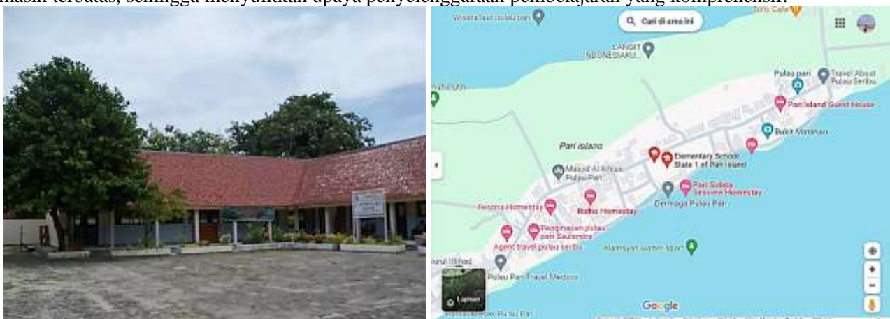
Gambar 1. Lokasi SMP Negeri Satu Atap 01 Pulau Pari

SMP Negeri Satu Atap 01 Pulau Pari, meskipun menjadi satu-satunya lembaga pendidikan menengah tingkat pertama di Pulau Pari, menghadapi sejumlah tantangan dalam memberikan pendidikan yang berkualitas kepada siswa-siswinya. Terletak di daerah terpencil, akses terhadap sumber daya pendidikan dan teknologi masih terbatas, sehingga menyulitkan upaya penyelenggaraan pembelajaran yang komprehensif.