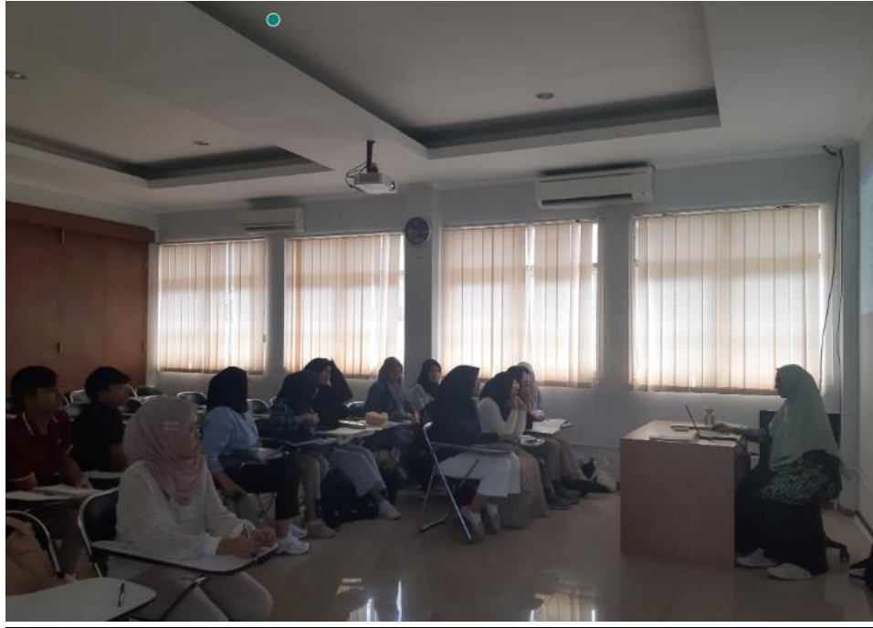
Dosen Pembimbing Akademik,