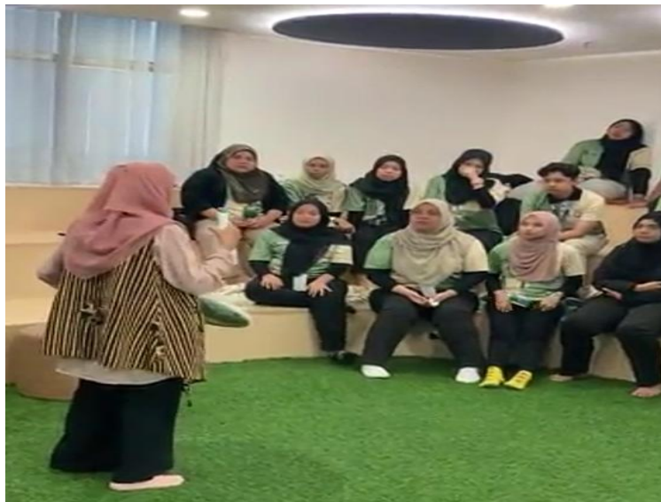
Gambar 1. Pemberian Informasi Oleh Tim Pengabdian

Berdasarkan gambar 1 dapat dilihat bahwa para peserta menyimak informasi yang disampaikan oleh pemateri. Pada sesi ini, pemateri juga menjelaskan mengenai pengetahuan dan keterampilan berwirausaha melalui ide penciptaan produk dengan kreasi decoupage yang memiliki berbagai manfaat seperti meningkatkan kreativitas dan membuka peluang usaha. Semua peserta memperlihatkan reaksi ekspresif karena teknik ini baru pertama kali mereka ketahui .