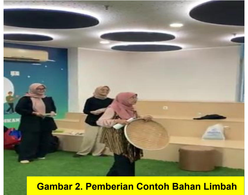
Gambar 2. Pemberian Contoh Bahan Limbah

Tahap ini juga peserta dapat melihat proses tahap demi tahap pembuatan dengan sangat antusias dan tidak sabar untuk mencoba sendiri.