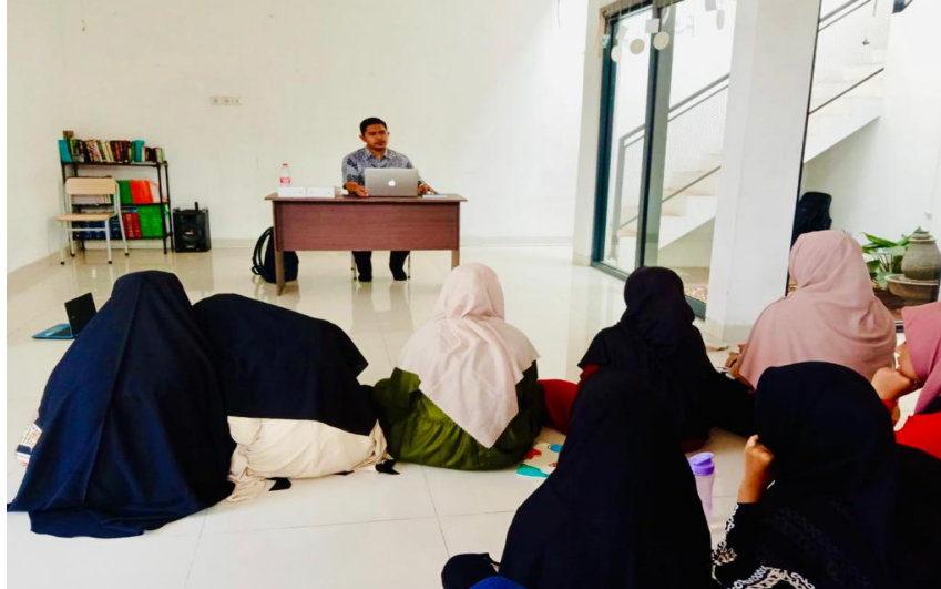
Gambar 2. Pendampingan Santri MQM Putri