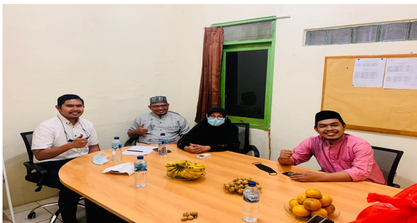
Gambar 1. Survei & Diskusi MQM Putri

Pada tahap ketiga adalah dilakukannya kegiatan pendampingan terhadap santri MQM Putri yang berlokasi disalah satu asrama. Kegiatan PKM berupa pelatihan wirausaha ini dilakukan selama 1 hari pada tanggal 6 Agustus 2022 pukul 09.00-15.00. Kegiatan dilakukan dengan beberapa cara yang bersifat praktis seperti Penjelasan materi wirausaha, Tanya Jawab, Diskusi dan Contoh kasus yang dibedah secara bersama-sama.