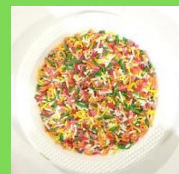
Ceres untuk tekstur makanan cincang halus