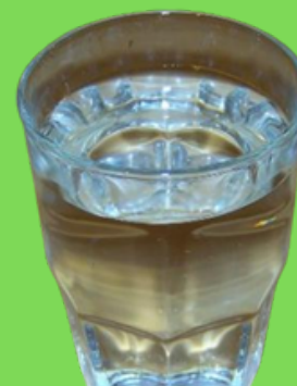
Air untuk tekstur makanan lumat