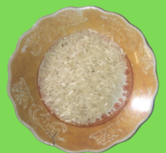
Beras untuk tekstur makanan keluarga