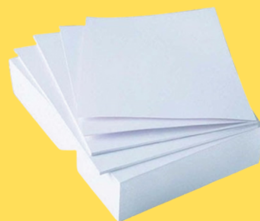
Kertas Art Cartoon Tipe GSM