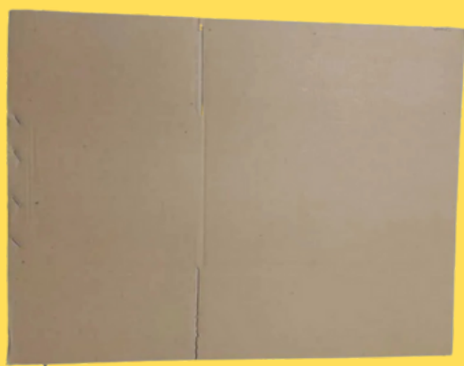
Kardus ukuran 40 x 60 cm