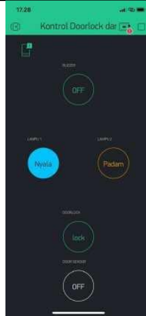
Gambar 2 Tampilan untuk menyalakan lampu 1 pada Aplikasi Blynk