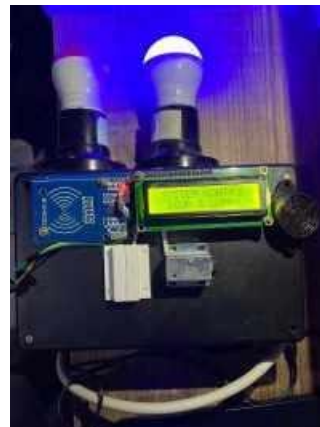
Gambar 3 Tampilan lampu 1 menyala

Rangkaian diatas dipasang secara parallel, namun jika kita ingin menyalakan lampu kedua maka dapat dilakukan dengan menekan tombol “Lampu2” maka lampu akan menyala sebagai berikut :