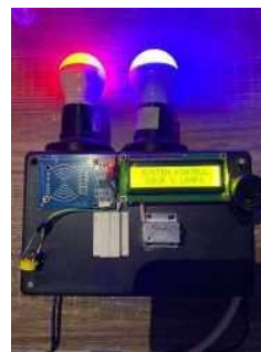
Gambar 5 tampilan lampu 1 dan 2 menyala

Tampilan diatas adalah ketika pengujian lampu 1 dan lampu 2 dinyalakan secara bersamaan dan lampu berhasil menyala.