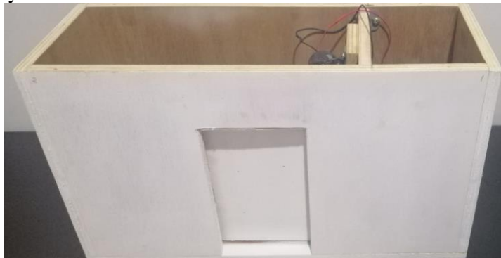
Gambar 1 Prototype Lemari mukena

Berikut adalah tampilan fisik lemari mukena, menggunakan raspberry pi 3, yang dikontrol adalah selenoid doorlock, lampu, buzzer melalui smart phone dan aplikasi Blynk.