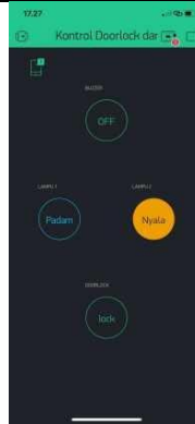
Gambar 4 Tampilan untuk menyalakan lampu 2 pada Aplikasi Blynk