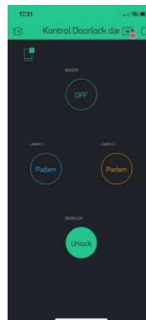
Gambar 6 Tampilan untuk membuka Doorlock via Aplikasi Blynk

Pada pengujian ini untuk membuka doorlock menggunakan Aplikasi Blynk dengan menekan tombol “Doorlock” maka doorlock akan terbuka, selanjutnya pengujian menutup doorlock kembali dengan menekan kembali tombol “Doorlock” maka tidak lama kemudian doorlock akan tertutup. Berikut hasil gambar pengtesan doorlock: