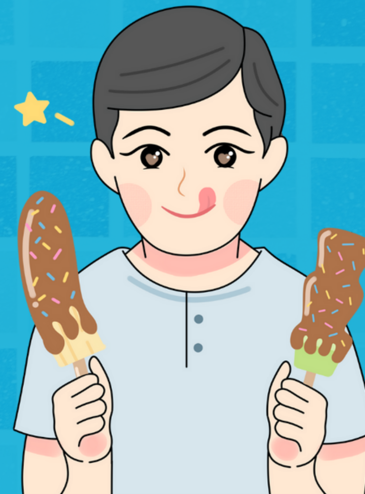
Setelah Menjamah Makan