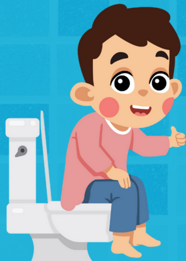
Sesudah Buang Air Besar