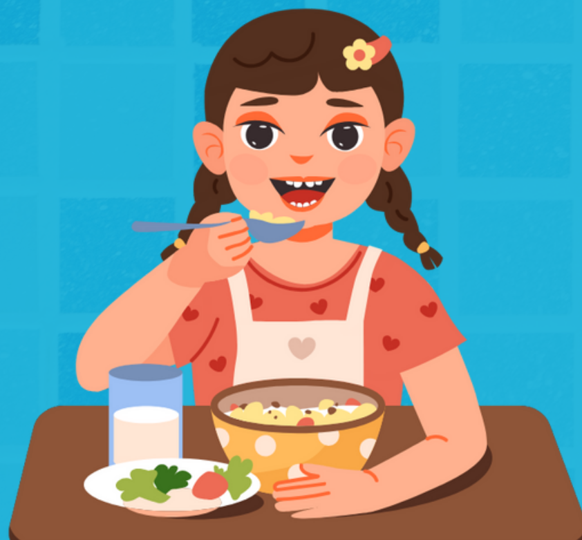
Sebelum dan Sesudah Makan