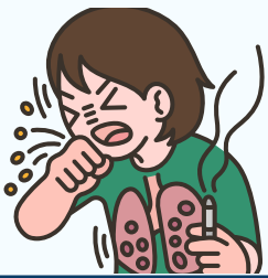
Infeksi Saluran Pernapasan