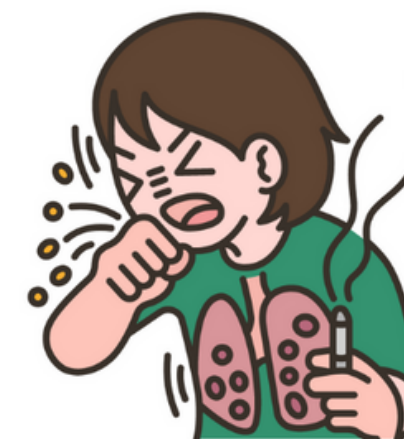
Infeksi Saluran Pernapasan