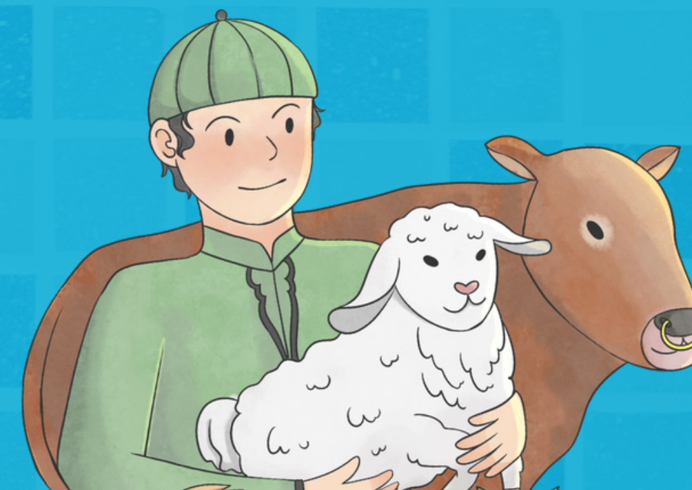
Setelah Memegang Hewan