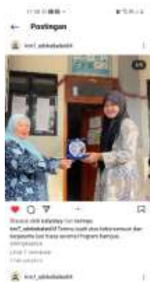
Pelepasan Mahasiswa di SDN Kebalen 04