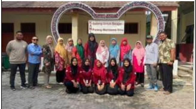
Pelepasan Mahasiswa di SDN Bahagia 02