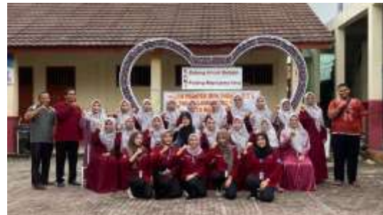
FKKS 2 di SDN Bahagia 02