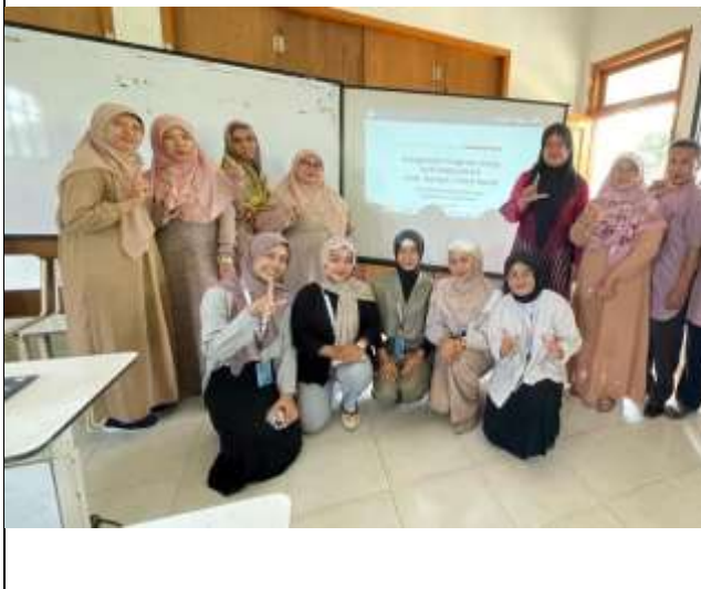
FKKS 3 di SDN Kebalen 04