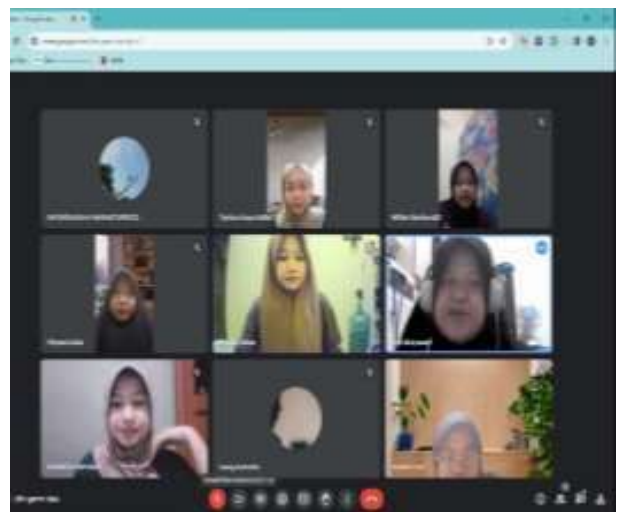
Sharing Seccion Di SDN Kebalen 04