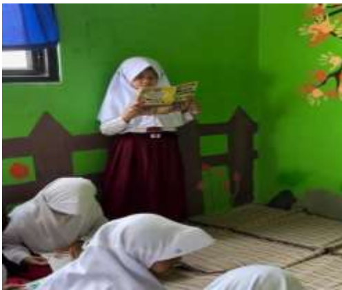
3. Membaca Nyaring