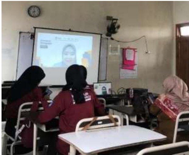
FKKS 1 di SDN Kebalen 04