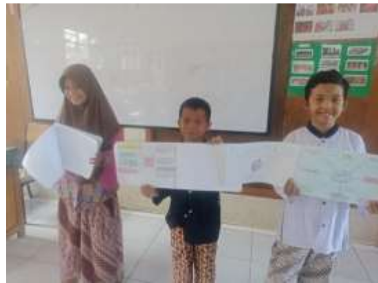
4. Mind Mapping