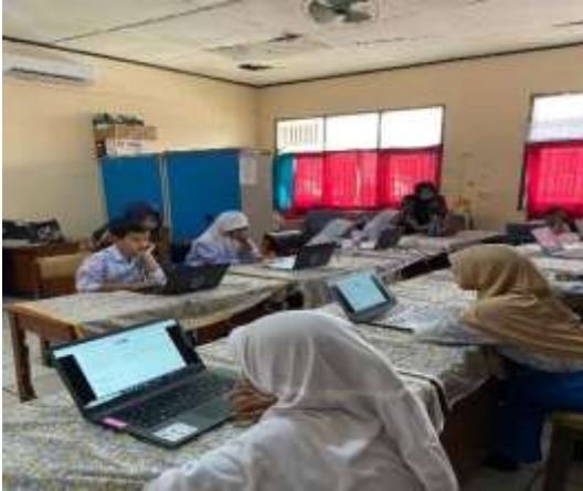
10. Pretest AKM