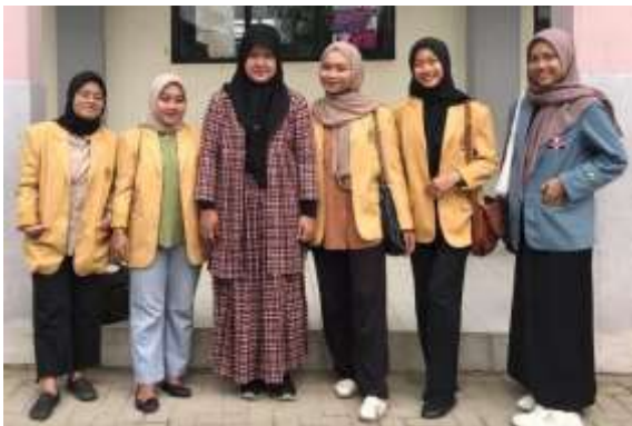
Kegiatan Penyerahan KM 7 di SDN Kebalen 04