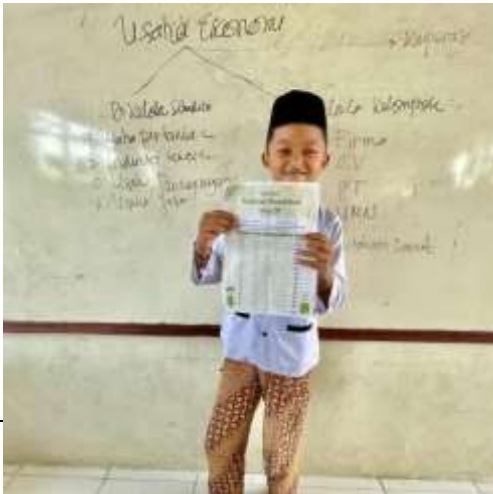
5. Lembar Kerja Ramadhan