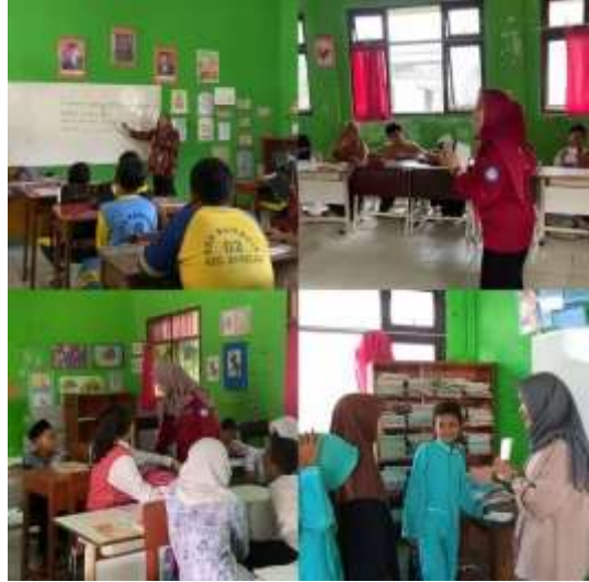
2. Vocab Builders