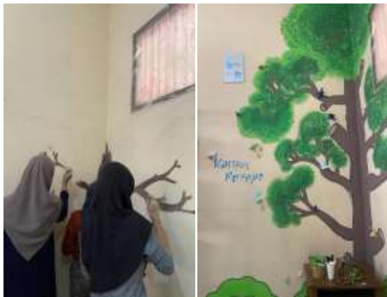
Kunjungan dan Sharing Seccion Luring di SDN Bahagia 02