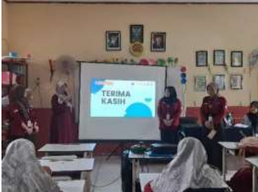
1. Presentasi RAK