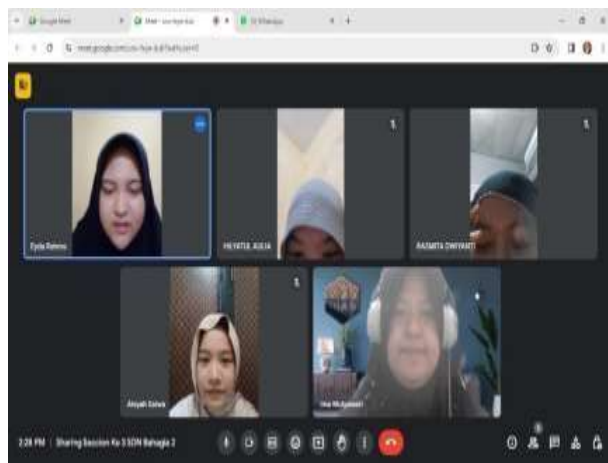
Sharing Seccion Di SDN Bahagia 02