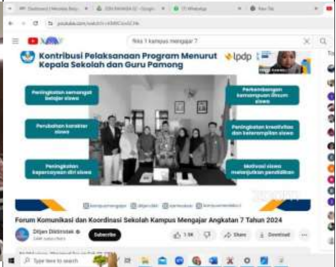
FKKS 1 di SDN Bahagia 02