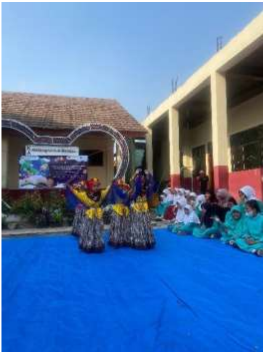
3. Festival Literasi Numerasi Hari Pendidikan Nasional