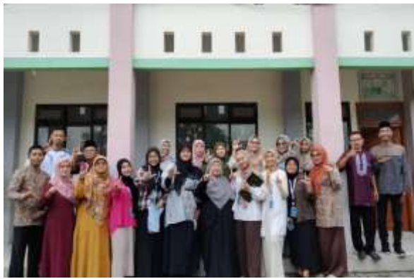
FKKS 2 di SDN Kebalen 04