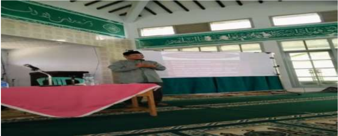
Lampiran 8: foto kegiatan