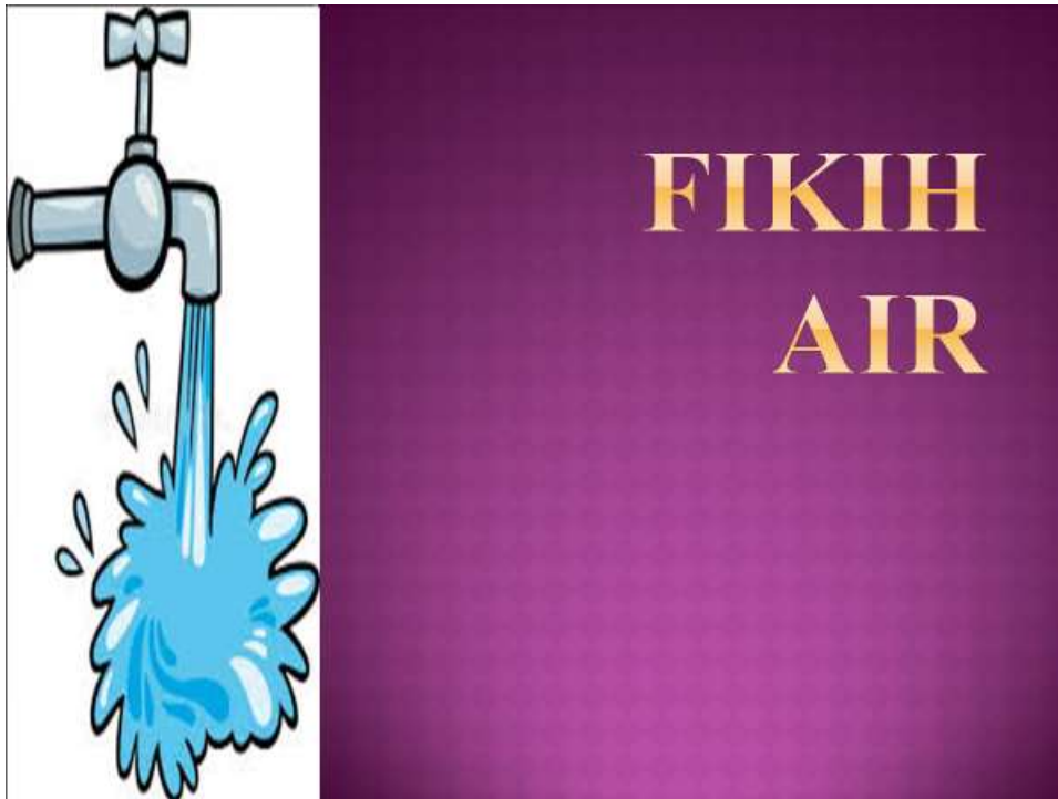
Lampiran 7: Materi Slide pengabdian masyarakat