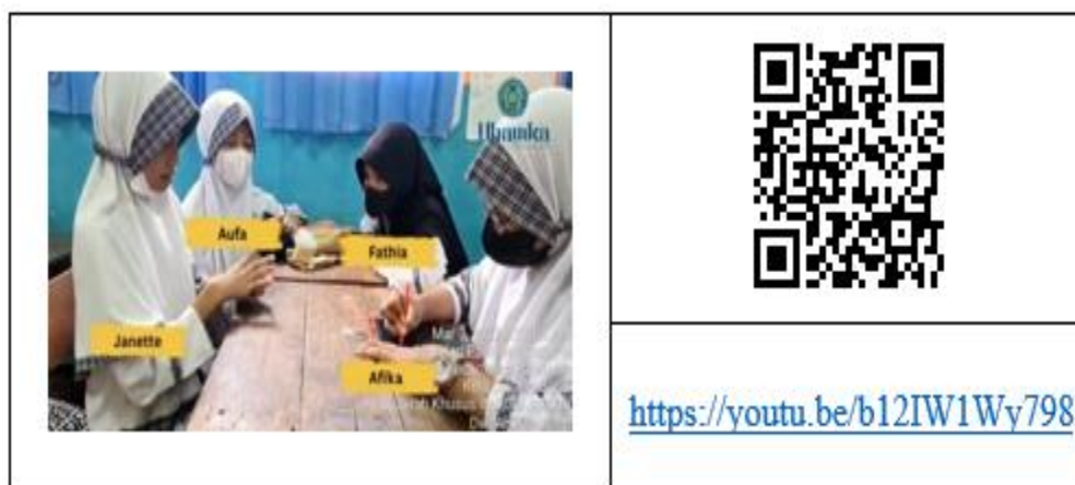
Gambar 4. Penerapan media kartu hitung level mudah Peserta didik kelas IV A SDN Palmerah 15 Pagi Kecamatan Palmerah – Kota Administrasi Jakarta Barat

Pelaksanaan pembelajaran menggunakan media kartu hitung level mudah dilakukan sebanyak 2 kali pertemuan, yakni pada tanggal 2 dan 3 Maret 2023.