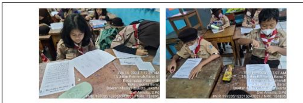
Gambar 3. Pengerjaan soal pretest oleh peserta didik kelas IV ASDN Palmerah 15 Pagi Kecamatan Palmerah – Kota Administrasi Jakarta Barat

Pelaksanaan pembelajaran menggunakan media kartu hitung level mudah dilakukan sebanyak 2 kali pertemuan, yakni pada tanggal 2 dan 3 Maret 2023.