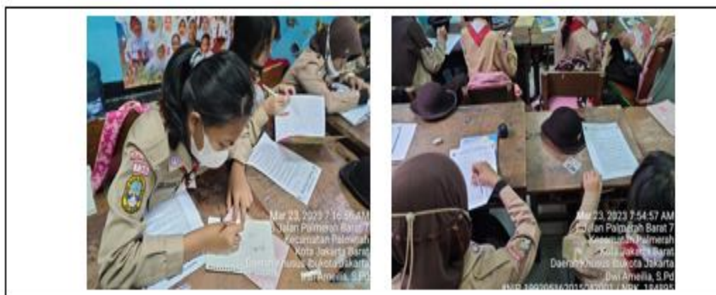
Gambar 5. Pengerjaan soal post-test oleh peserta didik kelas IV A SDN Palmerah 15 Pagi Kecamatan Palmerah – Kota Administrasi Jakarta Barat

Kegiatan post-test dilakukan pada tanggal 23 Maret 2023. Kegiatan ini dilakukan di kelas IV A, dengan menggunakan soal yang sama yang diberikan saat pretest.