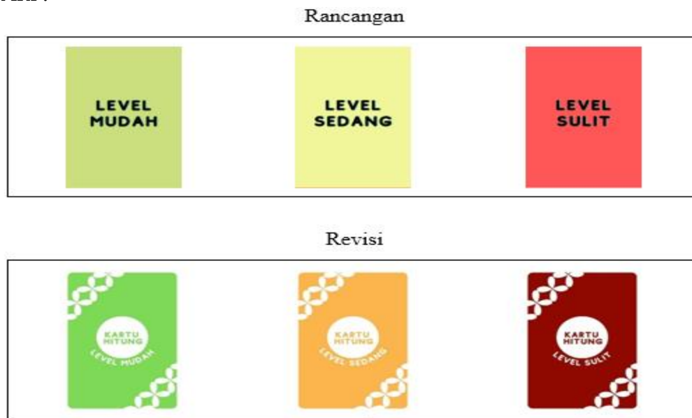
Gambar 1. Rancangan dan revisi tampilan belakang kartu hitung Materi pembagian kelas IV

Desain tampilan kartu hitung ini diadaptasi dari kartu domino, dimana bagian yang akan dimainkan terbagi menjadi dua bagian yakni atas dan bawah. Pada setiap tingkat kesulitan, warna dan penyajian pembagian dibedakan. Warna yang digunakan pada tingkat mudah adalah hijau, pada tingkat sedang adalah kuning, dan tingkat sulit adalah merah. Bagian belakang kartu dibuat sama pada setiap tingkat kesulitan, bertuliskan tingkat kesulitan kartu tersebut. Kemudian, direvisi dengan penambahan hiasan, penggantian warna yang lebih mencolok, pemberian identitas kartu hitung, serta tingkat kesulitan. Rancangan dan revisi bagian belakang kartu hitung dapat dilihat pada gambar di bawah ini :