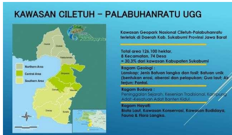
Gambar 1. Peta Objek Wisata UNESCO Global Geopark Ciletuh – Palabuhanratu.

Geopark Ciletuh – Palabuhanratu memiliki objek wisata yang sangat beragam, dimulai dari keragaman geologi, hayati, dan budaya. Keragaman geologi terdiri dari Geyser & Travertin Cisolok, Geyser Sukarame, Pantai Karanghahu, Pantai Cikembang, Pantai Cibangan, Pantai Pajagan, Pantai Palangpang, Pantai Minajaya, Pantai Cibuya, Puncak Habibie, Puncak Darma, Puncak Aher, Puncak Larangan, Lava Sukawayana, Gua Lalay, Studio Alam Girimukti, Curug Cimarunjung, Curug Sodong, Curug Cikanteh, Curug Awang, Curug Cikaso, Panenjoan, Pulau Kunti dan Gunung Badak, Pulau Mandra dan Gunung Manuk, Batu Naga dan Batu Batik, Gua Monyet, Taman Batu Waluran, dll. Keragaman Hayati terdiri dari Cagar Alam Sukawayana, Taman Durian Cikakak, Perkebunan Teh Bojong Asih, Hutan Konservasi Cipeucang, Budidaya Sidat, Mangrove Cikadal, Konservasi Penyu dll. Keragaman Budaya terdiri dari Kasepuhan Adat Sinar Resmi, Kasepuhan Adat Cipta Mulya, Kasepuhan Adat Cipta Gelar, Situs Megalitikum Pangguyangan, Situs Megalitikum Salak Datar, Situs Tugu Cengkuk, INNA SBH, Pantai Citepus & Tenjo Resmi, Vihara Dewi Kwan Im, Jembatan Bagbagan, Bunker Jepang, dll. Selain keragaman yang sudah disebutkan sebelumnya, terdapat keragaman objek wisata lain yang termasuk ke dalam objek wisata edukasi dan bisa menambah wawasan kita, diantaranya adalah Desa Wisata Hanjeli yang berada di Desa Waluran, dan Pojok Geopark yang berada di SDN Tegalcaringin (Putri, 2019).