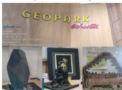
Gambar 4. Dokumentasi Observasi di Pojok Geopark

Kabupaten Sukabumi. Pojok Geopark berdiri dikarenakan menjadi salah satu upaya untuk memenuhi pilar edukasi Geopark khususnya untuk wisatawan dan pelajar. Sekolah tersebut merupakan salah satu sekolah dasar rujukan program edukasi Geopark Ciletuh - Palabuhanratu, pojok geopark menjadi salah satu penilaian penting disaat Geopark Ciletuh - Palabuhanratu ingin naik status menjadi UNESCO Global Geopark (UGG). Hal ini dilakukan untuk menanamkan rasa peduli khususnya bagi generasi muda. Permainan Monopoli Geopark dan pembentukan Geopark Corners di sekolah-sekolah merupakan dua inisiatif yang bertujuan untuk mengedukasi anak-anak tentang taman bumi. Selain itu, saat ini SDN Tegalcaringin sedang dikembangkan untuk menjadi inisiator di Kabupaten Sukabumi yang akan menerapkan pendidikan tentang taman bumi sebagai materi belajar mengajar.