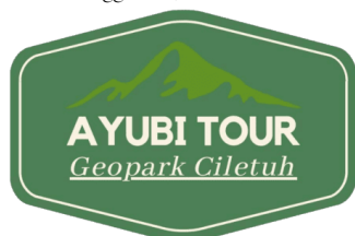
Gambar 9. Logo Ayubitour

“Geopark Ciletuh – Palabuhanratu sudah mengalami kemajuan dibandingkan dahulu, terutama ketika sudah di akui oleh UNESCO. Tingginya atensi wisatawan untuk berkunjung kesini memunculkan peluang yang sangat besar terutamanya untuk masyarakat lokal sendiri, saya sebagai masyarakat lokal pun merasakan dampak baik dari tingginya atensi tersebut. Maka tidak heran disini banyak sekali masyarakat lokal yang menjadi pemandu untuk wisatawan yang berkunjung, terutama dalam memberikan pengalaman wisata edukasi yang berkesan dan bermanfaat tidak hanya memberikan pengalaman dalam menikmati keindahan alamnya saja. Selain itu, kami disini mempunyai peran untuk selalu senantiasa bisa mengenalkan karakteristik, budaya, dan adat istiadat yang dimiliki oleh masyarakat yang berada dikawasan Geopark Ciletuh – Palabuhanratu” (Wawancara dengan Kang Ayubi Sopyan “Owner Biro Perjalanan AyubiTour” tanggal 21 Juni 2023)