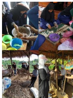
Gambar 3. Dokumentasi Desa Wisata Hanjeli Pojok Geopark

Wisata hanjeli merupakan desa eduwisata yang mempunyai daya tarik tentang pangan lokal hanjeli. Selain itu, banyak atraksi wisata yang dapat dilihat saat berkunjung ke objek wisata hanjeli, dimulai dengan adanya pengenalan atraksi panen hanjeli, numbuk hanjeli di lisung, nampi hanjeli di nampah, pengolahan olahan rengginang, dan pembuatan dodol dari proses awal sampai akhir, serta wisatawan dapat menikmati hidangan nasi liwet hanjeli yang merupakan makanan khas daerah di Desa Wisata Hanjeli ini. Secara fisiografis, desa wisata hanjeli berada dalam bentang alam plato jampang yang memiliki umur dalam periode Miosen (17–28 juta tahun lalu). Daratan ini merupakan daratan yang terendapkan ke dasar laut akibat dari gunung berapi yang sudah punah, kemudian terangkatkan ke permukaan dan membentuk daratan tinggi. Karena material endapan yang ditinggalkan oleh gunung berapi yang sudah punah ini menyebabkan tanah di kawasan dataran tinggi Jampang cenderung kering. Desa wisata hanjeli sangat menekankan prinsip keberlanjutan ( sustainable ) dalam semua aspek geologi, keanekaragaman hayati, dan budayanya, Selain itu, dalam mendirikan badan usaha lokal desa wisata hanjeli selalu mengedepankan identitas kedaerahan untuk membantu masyarakat dalam mengapresiasi dan memahami manfaat dari keunggulan Desa Wisata Hanjeli.(Setiawan et al., 2020)