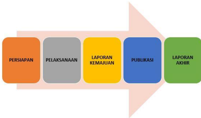
Diagram Alir Penelitian

Hasil penelitian kemudian akan dipublikasikan pada jurnal ilmiah terakreditasi sinta 2