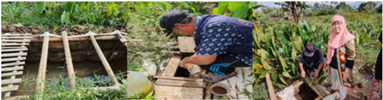
Gambar 1. Lokasi Pengmas Keramba Ikan lele Andir Farm