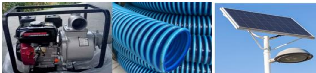
Gambar 3. Perangkat yang diperlukan dalam pengmas Pemberdayaan Masyarakat

Setelah melakukan survey lapangan maka dibuatlah rencana kerja untuk mempermudah program kegiatan masyarakat ini yaitu Tim PKM melakukan persiapan Pengabdian Masyarakat berupa penyiapan alat lampu panel surya dan motor pompa diesel penyedot air keramba juga berupa materi ajar Modul maintenance peralatan.