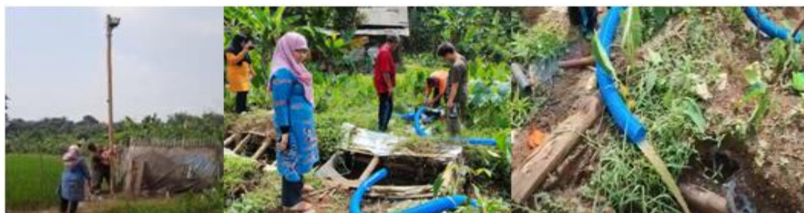
Gambar7. Pemasangan Alat Pemberdayaan Masyarakat (Pompa Air) dan pemasangan Lampu PJU

Selanjutnya Tim mencobakan mesin pompa air, Pompa adalah suatu peralatan mesin yang digunakan untuk memindahkan suatu cairan ( Fluida ) dari suatu tempat ketempat yang lain melalui media pipa dengan cara mendorong fluida langsung secara mekanik melalui saluran pipa atau merubah energi mekanik menjadi energi tekanan atau energi kinetic (Kurniawan, Saragih, & Hasballah, 2021). Dalam artikelnya menyebutkan bahwa Pada dasarnya dalam memilih suatu pompa air untuk tujuan maksud tertentu maka terlebih dahulu harus diketahui kapasitas alirannya serta head untuk mengalirkan zat cair/fluida yang akan dipompa. Sebuah pompa air biasanya untuk suatu kapasitas dimana (Q), head (H), dan putaran (n) tertentu maka karakteristik pada suatu putaran konstan secara teori derasnya aliran air (Debit Air) tergantung pada ketinggian (Head) dan putaran mesin pompa air. Hasilnya semua yang diuji coba sudah berhasil dalam waktu yang tidak terlalu lama, pelaksanaan pengmas ini membuahkan hasil yang bisa dimanfaatkan oleh Petani Andir Farm untuk budidaya lahan tambak lele ini.