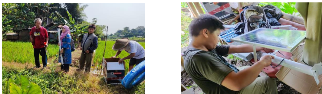
Gambar 4. Proses pelaksanaan pengmas di lokasi pengmas

(Pajarianto, 2019). Hasil yang dicapai adalah terpasangnya lampu PJU dan berhasilnya mesin Diesel Pompa air penyedot air keramba untuk mengosongkan keramba, ditunjukkan pada gambar :