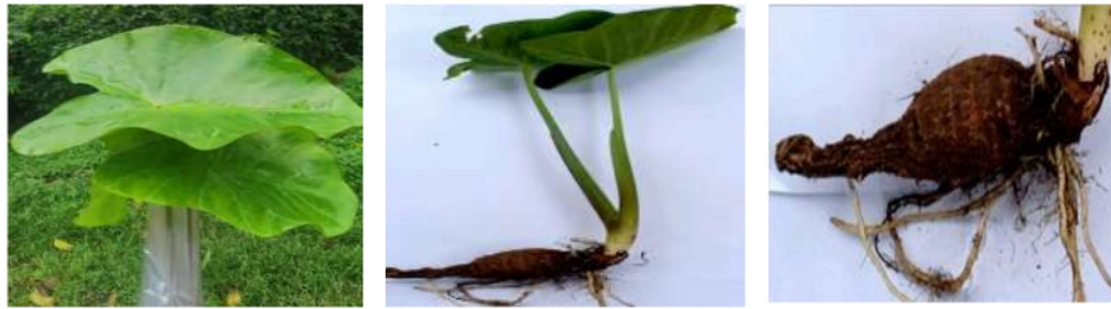
Gambar 1. Daun, batang dan umbi tanaman talas