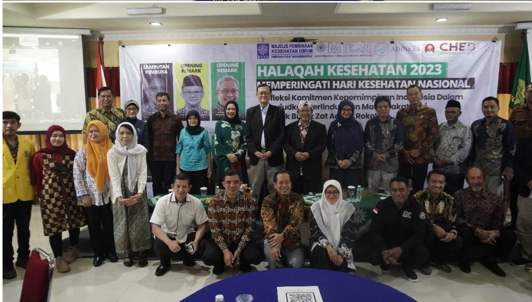
Foto Bersama Narasumber dan Pengisi Acara Halqa Kesehatan