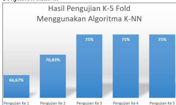
Gambar 8. Diagram Chart Pengujian Algoritma K-NN

Sesuai dengan rujukan dari gambar 8, dapat dipahami bahwa diagram chart menunjukkan setiap pengujian algoritma K-NN yang dimulai dari pengujian ke 1 dengan perolehan akurasi sebesar pengujian sebesar