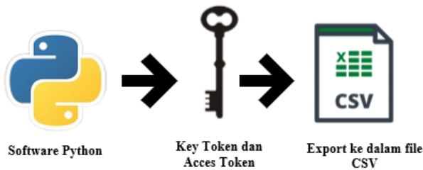
Gambar 2. Tahap Crawling Data

Data crawling berasal dari tweets media sosial twitter terkait “kelangkaan minyak goreng”. Gambar 2 merupakan tahap dari crawling data.