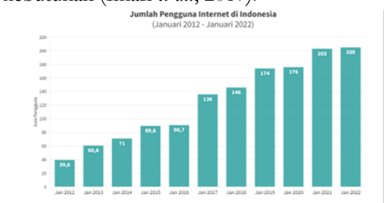
Gambar 1. Data Pengguna Media Sosial Indonesia

Internet merupakan suatu sistem atau teknologi yang menghubungkan orang satu dengan yang lain tetapi dibatasi oleh jarak. Internet telah berkembang pada tingkat yang semakin cepat dalam periode kemajuan teknis yang terus meningkat ini, dan hampir semua orang mengenalnya. Jutaan hingga miliaran orang terhubung ke internet baik secara lokal maupun global. Internet sekarang digunakan untuk lebih dari sekedar mengirim data antar tempat kerja bagi sebagian besar orang, itu hampir menjadi kebutuhan (Imari et al. , 2017).