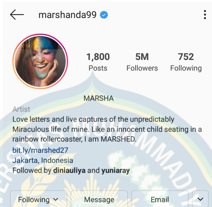
Gambar 1.2 Akun Instagram Marshanda