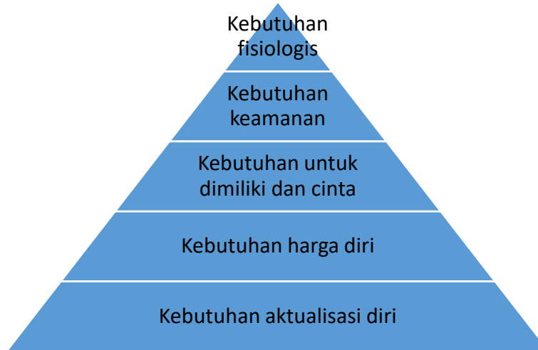
Gambar 2.1, Piramida Maslow

Kebutuhan fisiologis adalah kebutuhan paling mendasar dan primer, seperti halnya makanan dan minuman. Rasa aman ini termasuk di dalamnya adalah rasa aman dari ancaman, kerugian, kehilangan, dan sebagainya. Setelah kebutuhan akan rasa aman terpenuhi maka kebutuhan untuk diterima dan dicintai oleh orang lain. Sebagai makhluk sosial manusia sangat membutuhkan ini. Dan setelahnya adalah kebutuhan akan penghargaan ( self esteem ), dan setelah ini terpenuhi, kebutuhan berikutnya adalah aktualisasi diri. Semua kebutuhan tersebut merupakan kebutuhan manusia baik sebagai individu maupun sebagai makhluk sosial yang tidak dapat memenuhi seluruh kebutuhannya sendiri. Jadi manusia bagaimanapun keadaannya selalu membutuhkan orang lain, dan kebutuhan itu dapat terpenuhi jika manusia berkomunikasi dengan manusia lain. Tanpa adanya manusia lain, ada kebutuhan yang tidak akan terpenuhi pada manusia.