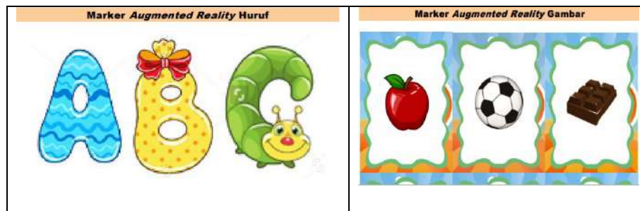
Gambar 3. Marker Augmented Reality

Kegiatan sesi 2 materi yang disampaikan adalah Instalasi program AR Pada Handphone Peserta. Peserta dan Cara Penggunaan AR Sebagai Media Pembelajaran yang disampaikan oleh Estu Sinduningrum, S.T., M.T. Berdasarkan kebutuhan alat praktik yang telah dipersiapkan sebelumnya, yaitu: marker AR Huruf Alfabet, Marker AR Gambar dan Quota Internet . pematiri memberikan arahan langkah melakukan instalisasi Program AR dan membantu peserta mendownload aplikasi android di playstore peserta. Selanjutya menuntun cara menggunakan AR. Kamera yang dipergunakan peserta mendeteksi marker huruf dan gambar yang diberikan, kemudian setelah mengenali dan menandai pola marker webcam akan melakukan perhitungan apakah marker sesuai dengan database yang dimiliki. Bila tidak maka informasi marker tidak akan diolah, tetapi bila sesuai maka informasi marker akan digunakan untuk me-render dan menampilkan objek 3D atau animasi yang telah dibuat sebelumnya.