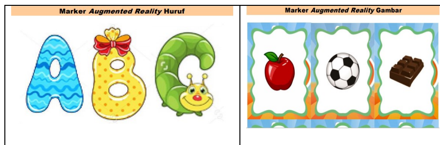
Gambar 3. Marker Augmented Reality

Kegiatan sesi 2 materi yang disampaikan adalah Instalasi program AR Pada Handphone Peserta. Peserta dan Cara Penggunaan AR Sebagai Media Pembelajaran yang disampaikan oleh Estu Sinduningrum, S.T., M.T. Berdasarkan kebutuhan alat praktik yang telah dipersiapkan sebelumnya, yaitu: marker AR Huruf Alfabet, Marker AR Gambar dan Quota Internet . pemateri memberikan arahan langkah melakukan instalisasi Program AR dan membantu peserta mendownload aplikasi android di playstore peserta. Selanjutnya menuntun cara menggunakan AR. Kamera yang dipergunakan peserta mendeteksi marker huruf dan gambar yang diberikan, kemudian setelah mengenali dan menandai pola marker webcam akan melakukan perhitungan apakah marker sesuai dengan database yang dimiliki. Bila tidak maka informasi marker tidak akan diolah, tetapi bila sesuai maka informasi marker akan digunakan untuk me-render dan menampilkan objek 3D atau animasi yang telah dibuat sebelumnya.