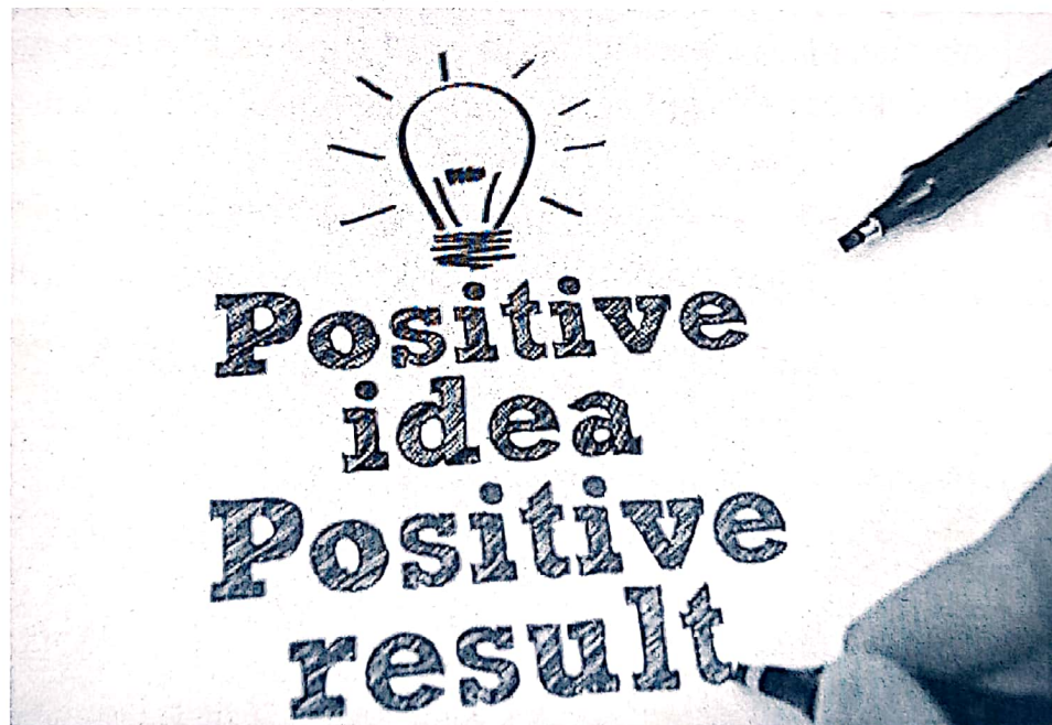
Gambar 6.2. Ide Positif dalam Wirausaha

Setelah ketiga langkah di atas dilakukan, kumpulkanlah ulasan dari para calon pembeli, dan gunakan itu sebagai acuan untuk mengembangkan ide bisnis yang telah dirintis.