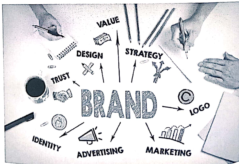
Gambar 6.3 Langkah-langkah setelah menentukan Brand/Merek