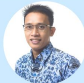
Sabran Politeknik Negeri Jember

Google Scholar : J1AkpWAAAAJ ID Sinta : 6721163