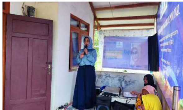
Gambar 1. Pemaparan materi pengenalan budidaya maggot ke peserta pelatihan

Capaian kegiatan yang sudah dilakukan yaitu meningkatkan pengetahuan dan kesadaran masyarakat terhadap kesehatan dan lingkungan sekitarnya, dengan melakukan presentasi oleh tim dengan judul materi “perilaku masyarakat tidak pro lingkungan dan dampak sampah organik bagi kesehatan”. Pemaparan materi ini, masyarakat mengetahui dampak negatif sampah bagi kesehatan manusia seperti penyakit hepatitis A, disentri/peradangan usus, penyakit pes, dan demam berdarah. Pelatihan budidaya maggot, dengan mengenalkan dan melatih masyarakat dalam pengelolaan sampah organik, membuat budidaya maggot dan pengolahan hasil panennya dengan melaksanakan pembuatan kandang maggot sampai pengolahan maggot menjadi tepung.