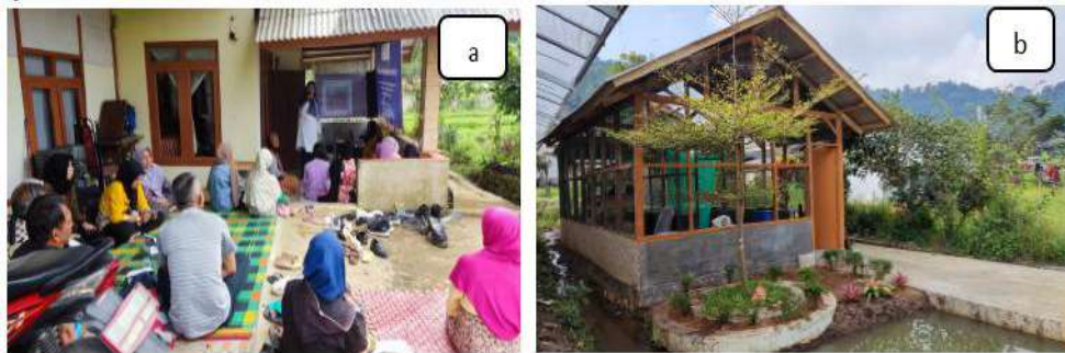
Gambar 2. a) Proses pelatihan budidaya maggot dan b) rumah maggot di Desa Ciputri

cicak, tikus, dan semut. Selain itu, manfaat penggunaan kawat jaring agar ventilasi atau pertukaran udara tetap bersirkulasi dengan baik. Suhu lingkungan di dalam kandang di rumah maggot Desa Ciputri sekitar 20-23°C. Suhu optimal dalam perkembangan telur hingga menjadi lalat BSF sebesar 30°C (Wahyuni et al. 2021). Jika suhu udara melebihi suhu optimal, larva akan keluar mencari sumber pakannya untuk mencari tempat yang lebih dingin dengan bersembunyi sela-sela atau dibawah wadah. Jika suhu udara terlalu dingin, metabolisme atau proses pencernaannya akan melambat yang akibatnya larva maggot akan lebih sedikit makannya sehingga pertumbuhannya menjadi lambat (Dortmans et al. 2017).