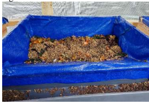
Gambar 4. Pemberian pakan maggot BSF

Tahapan maggot BSF mempunyai kulit putih dari ukuran kecil hingga cukup besar yang terjadi sekitar 12 hari. Maggot yang ukuran cukup besar dan warna kulit mulai menghitam berubah menjadi pre pupa, akan berpindah atau migrasi sendiri ke tempat yang kering dan bersih dalam waktu seminggu yang berubah menjadi pre pupa. Pada saat bak penampungan terkena air, pre pupa akan bergerak berpindah tempat kembali. Fase pre pupa tidak diberikan pakan atau berpuasa dan akan berganti kulit hingga menjadi pupa sempurna yang mencari tempat yang gelap. Perubahan dari pre pupa menuju pupa sempurna selama lima hari. Pada fase imago atau lalat BSF akan muncul pada hari ke 32 (Wahyuni et al. 2021). Proses perubahan dari fase pupa menjadi lalat BSF disebut pupasi. Lalat BSF yang keluar akan hinggap dan diam di jaring selama lima menit, adanya proses pengeringan dan mengembangkan sayapnya untuk terbang (Dortmans et al. 2017). Lamanya siklus maggot BSF tidak selalu sama antar lokasi, tergantung pada cahaya matahari, kondisi suhu udara, banyaknya BSF dalam kandang, dan kualitas induk, lamanya penetasan telur (Hardini dan Gandhy 2020). Selain itu, pengalaman sumber daya manusia dalam memelihara maggot juga mempengaruhi lamanya siklus seperti jenis pakan, bobot pakan dan berapa kali pakan yang diberikan selama sehari.