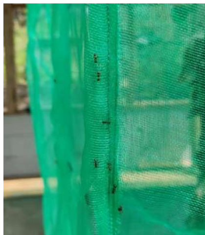
Gambar 3. Predator alami (semut) dari larva maggot BSF

Rumah maggot Desa Ciputri memiliki lantai dan dinding bagian dalam yang sudah di plester semen sampai halus, saat sampah organik atau maggot jatuh ke lantai dapat langsung dibersihkan menggunakan sapu dan kain lap dengan cepat dan bersih. Jika tekstur lantai kasar, kotoran yang menempel akan susah dibersihkan sehingga yang dapat menyebabkan mengeluarkan bau tidak sedap dan bakteri akan berkembang biak lebih cepat yang berakibat pada kesehatan pengelola rumah maggotnya.