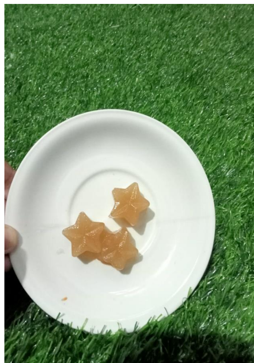
Gambar 1. Permen Jahe

Resep Hard Candy Jahe adalah permen jahe yang ditambahkan dengan rempah lainnya dan menggunakan pemanis alami berupa gula aren. Proses pembuatan hard candy juga sudah lebih modern menggunakan peralatan berteknologi tinggi sehingga rasa jahe asli yang sangat berkhasiat menghangatkan badan dan dipercaya bisa mengatasi masuk angin tetap terjaga. Komposisi resep permen jahe berikut adalah komposisi untuk usaha jika untuk resep berdasarkan hasil riset tentu sudah menggunakan komposisi yang tepat.