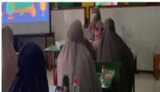
Gambar 2. Proses Pendampingan

Dalam kegiatan pendampingan ini, ampas yang awalnya dianggap tidak memiliki manfaat dan memiliki nilai jual yang cukup tinggi (Sukmawati & Sunaryo, 2021a).