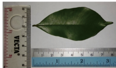
Gambar 2. Daun segar gaharu

Hasil pemeriksaan mikroskopik serbuk simplisia daun gaharu (Gambar 3) terlihat fragmen mesofil, stomata tipe anomositik, jaringan palisade, kristal oksalat berbentuk prisma, xilem dengan penebalan spiral, dan rambut penutup uniseluler. Menampang melintang daun segar gaharu (Gambar 4) memperlihatkan ada kutikula, stomata, jaringan epidermis tersusun dari sel-sel yang rapat dan berbentuk persegi panjang terdiri dari 1 lapis epidermis atas dan 1 lapis epidermis bawah. Jaringan mesofil terdiri dari jaringan palisade dan jaringan bunga karang. Jaringan pengangkut yaitu xilem dan floem (Purnamasari, 2014)