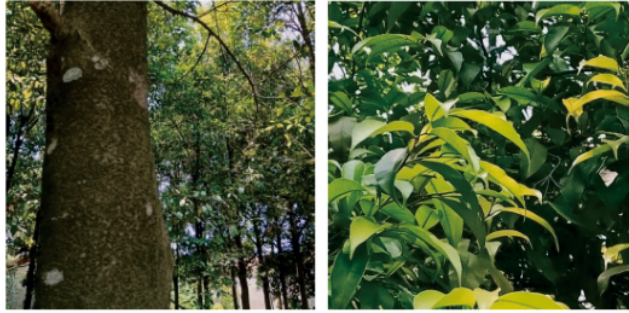
Gambar 1. Gambar makroskopik tumbuhan gaharu ( Aquilaria malaccensis Lam.)

gangguan tidur, baik dari segi kualitas juga kuantitas. Prevalensinya pun cenderung meningkat setiap tahun. Sekitar 20%-50% orang dewasa dan lansia mengalami insomnia tiap tahun bahkan 17% diantaranya mengalami masalah serius. Beberapa jenis obat dari golongan sedatif-hipnotik biasanya digunakan untuk mengatasi masalah insomnia. Namun jika penggunaan jenis obat-obatan tersebut secara terus menerus dan tidak rasional, dapat menyebabkan ketergantungan fisik dan gejala putus obat. Solusi lain yang dicari untuk mengatasi masalah gangguan tidur (insomnia) melalui penggunaan obat-obatan tradisional. Masyarakat pada umumnya menggunakan obat tradisional berbahan tumbuh-tumbuhan berdasarkan pengalaman secara turun temurun, dan masih berlangsung sampai sekarang –(Kamaluddin dkk, 2017).