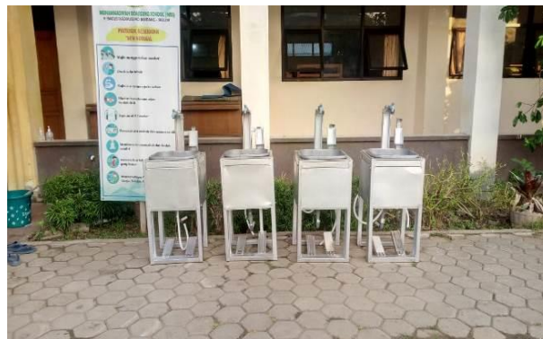
Gambar 6. Sarana Cuci Tangan di Pondok Pesantren

Salah satu agenda lain dalam kegiatan ini ialah pembuatan sarana cuci tangan dengan air mengalir dan sabun. Mencuci tangan secara teratur dengan benar menjadi salah satu upaya dalam pencegahan COVID-19 mengingat salah satu cara penularan COVID-19 ialah melalui sentuhan tangan yang terkontaminasi terhadap mata, mulut maupun hidung. Adapun jumlah sarana cuci tangan sebanyak 8 buah di masing-masing Pondok Pesantren. Pengadaan sarana cuci tangan juga menjadi penting mengingat sebuah studi dari UNICEF menyatakan bahwa masih terdapat sekitar 40% dari populasi dunia yang tidak memiliki sarana cuci tangan dengan air mengalir dan sabun di rumahnya (UNICEF, 2020).