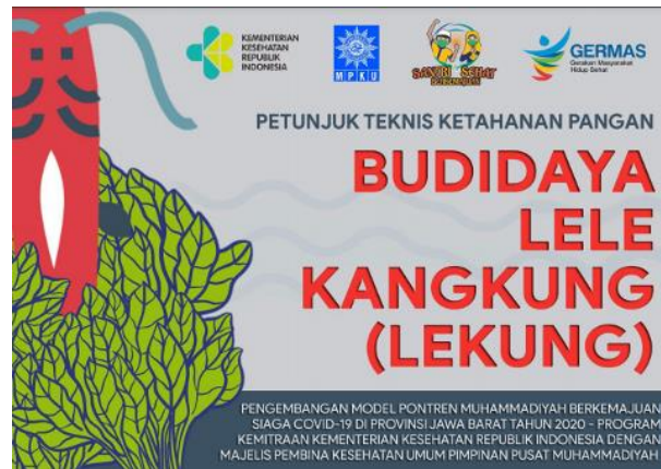
Gambar 3. Sampul Buku Panduan Budidaya Lele Kangkung (Lekung)