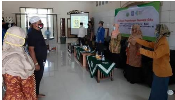
Gambar 5. Workshop dan Orientasi Pesantren Siaga COVID-19 secara daring dan luring

Muhammadiyah untuk melakukan penggerakan masyarakat dalam Pencegahan COVID-19. Peserta terdiri dari Kader Pondok Pesantren masing-masing 30 orang, tim gugus tugas COVID-19 kelurahan/desa. Adapun narasumber dari masing-masing kegiatan berasal dari tim pelaksana pengabdian masyarakat serta Pimpinan/Staf Dinas Kesehatan Kota Depok dan Kabupaten Bogor. Kegiatan orientasi dan workshop menjadi agenda penting untuk dapat mewujudkan koordinasi lintas sektor atau konsep helix mengingat salah satu langkahnya ialah bagaimana merangkul berbagai pemangku kepentingan dengan cara melakukan komunikasi secara teratur (GRRIP, 2021).