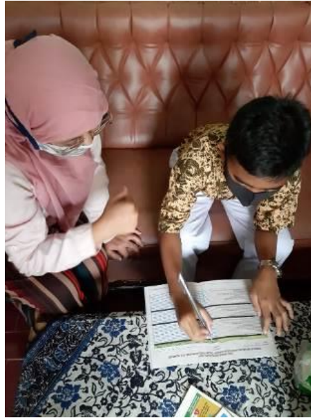
Gambar 7. Proses pemantauan perilaku pencegahan COVID-19