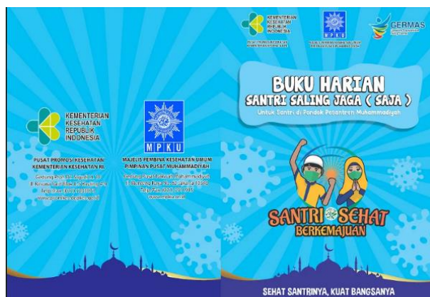
Gambar 2. Buku Harian Santri Saling Jaga

panduan terakit pencegahan COVID-19 serta panduan Perilaku Hidup Bersih dan Sehat pada tantangan Pondok Pesantren yakni mencuci tangan pakai sabun, membuang sampah pada tempatnya, jajan di kantin sekolah yang sehat, menggunakan jamban sehat, berolahraga yang teratur dan terukur, memberantas jentik nyamuk, tidak merokok di sekolah, menimbang berat bada dan mengukur tinggi badan setiap bulan, menjaga kebersihan diri, memelihara kesehatan reproduksi, memelihara kesehatan jiwa dan mengonsumsi makanan sehat serta menggunakan air bersih. Gambar cover buku santri husada dapat dilihat di gambar 2.