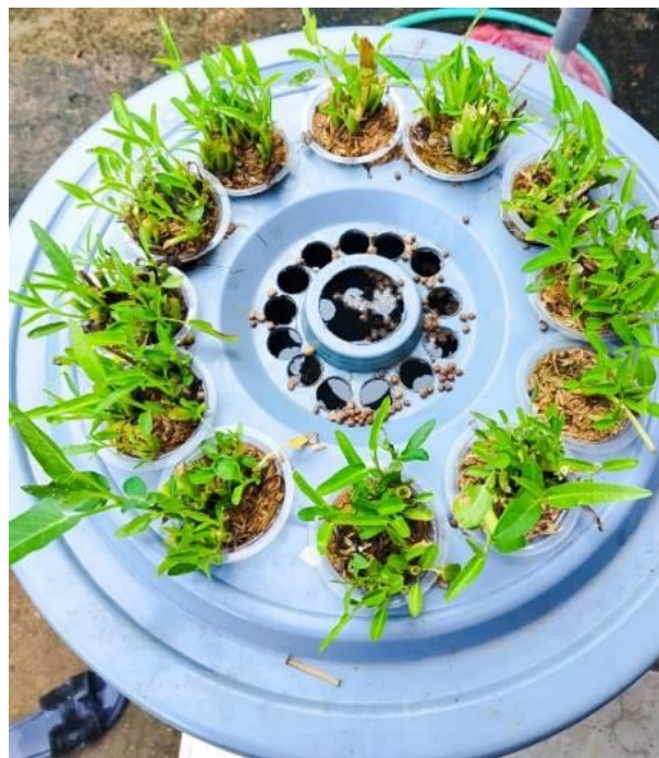
Gambar 4. Bentuk Budidaya Lele Kangkung di Pondok Pesantren