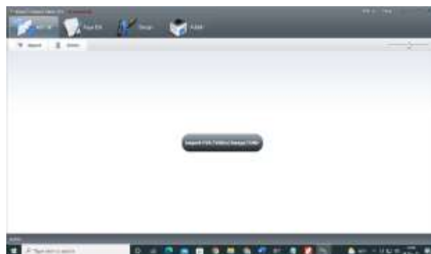
Gambar 2. Tampilan Aplikasi Flipbook

Flipbook juga termasuk ke dalam kategori media digital sound slide yang mana media tersebut adalah salah satu dari jenis media audio-visual (Amanullah, 2020). Flipbook dipilih karena sifatnya yang responsif (Septianto, Tri, Mahsunah, Evi Murni, 2022). Digital sendiri memiliki artian sebagai suatu cara atau program adaptif yang kehdairannya menjadi suatu kebutuhan pokok dalam kehidupan manusia. Digital merupakan suatu rancangan yang dibuat sebagai konsep pemahaman di tengah-tengah berkembangnya zaman yang menjadikan hal rumit menjadi mudah, serta mengubah sifat yang sebelumnya manual menjadi otomatis (Aji, 2016). Pengembangan bahan ajar yang inovatif seperti Flipbook akan membantu peserta didik mempersiapkan keterampilan baru yang relevan di abad ke-21 (Asrizal et al., 2018).