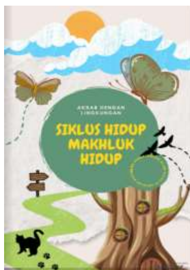
Gambar 3. Tampilan Sampul Modul Elektronik Berbasis Digital Flipbook

Modul elektronik berbasis aplikasi flipbook digital ini disusun dengan menyesuaikan Kompetensi Inti (KI), Kompetensi Dasar (KD), dan Indikator. Pengembangan bahan ajar berupa modul elektronik ( e-modul ) ini memiliki ukuran A4 dan menyajikan materi dengan tema ‘Siklus Hidup Makhluk Hidup’ yang di dalamnya membahas mengenai siklus hidup hewan, siklus hidup tumbuhan, pelestarian makhluk hidup, membuat poster pelestarian hewan dan tumbuhan. Modul elektronik ( e-modul ) yang telah rampung nantinya dipublikasikan dalam bentuk SWF HTML yang bisa dikirimkan kepada peserta didik melalui aplikasi daring penunjang pembelajaran seperti Whatsapp, E-Mail, dan lainnya (Sa’diyah, 2021).