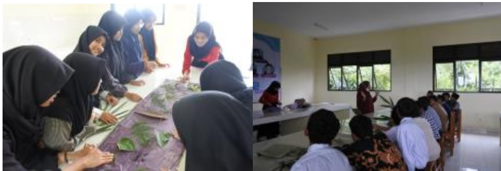
Gambar 2. Pelatihan Perangkat Pembelajaran Berbasis STEAM Bagi Guru IPA secara offline

Data yang diperoleh berdasarkan hasil kuesioner yang dibagikan kepada para peserta mengenai Pelatihan Perangkat Pembelajaran Berbasis STEAM Bagi Guru IPA diakhir kegiatan menunjukkan hasil yang disajikan dalam Tabel 1.