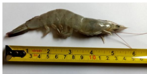
Gambar 1. Skema sistem pencernaan udang vaname (Corteel 2013)

Sebanyak 0,1 mL ekstrak kasar enzim ditambahkan 5 mL pereaksi Bradford, divortex dan diinkubasi selama 10 menit. Serapan diukur menggunakan Spektrofotometer UV-Vis pada panjang gelombang maksimum (Malle et al. 2015). Panjang gelombang maksimum yang diperoleh sebesar 593,5 nm. Kadar protein dihitung menggunakan persamaan kurva standar larutan BSA ( bovine serum albumin ).