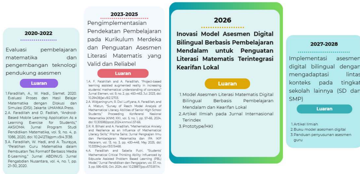
Gambar 1. Roadmap Penelitian