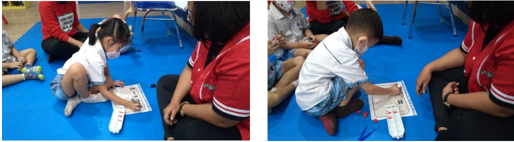
Gambar 2. Play Ten Frame Pom-Pom Substraction

Hal ini dapat dipastikan bahwa adanya peningkatan minat belajar anak dalam aspek kognitif.