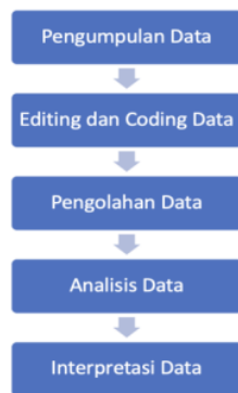
Gambar 1. Alur Proses Pengolahan Data dan Analisis Data

Berikut adalah alur yang dapat digunakan dalam proses pengolahan dan analisis data: