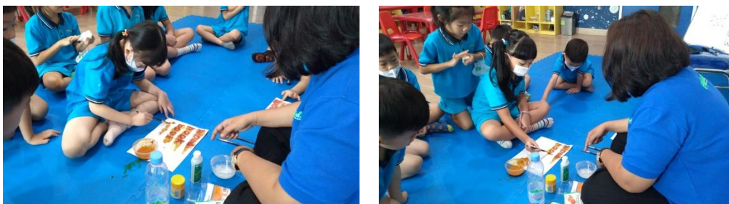
Gambar 3. Play Turmeric Invisible Ink

Menurut penelitian yang dilakukan oleh menjelaskan bahwa belajar melalui PBL (play based learning) sebagai strategi penting untuk mendorong keterlibatan guru dalam pengembangan keterampilan holistik setelah usia prasekolah [23]. Proses belajar