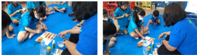
Gambar 3. Play Turmeric Invisible Ink

Menurut penelitian yang dilakukan oleh menjelaskan bahwa belajar melalui PBL (play based learning) sebagai strategi penting untuk mendorong keterlibatan guru dalam pengembangan keterampilan holistik setelah usia prasekolah [21]. Proses belajar melalui PBL adalah sesuai dengan perkembangan anak usia dini karena hal ini meningkatkan rasa ingin tahu sekaligus memudahkan transisi yang sulit dari taman kanak-kanak ke sekolah.