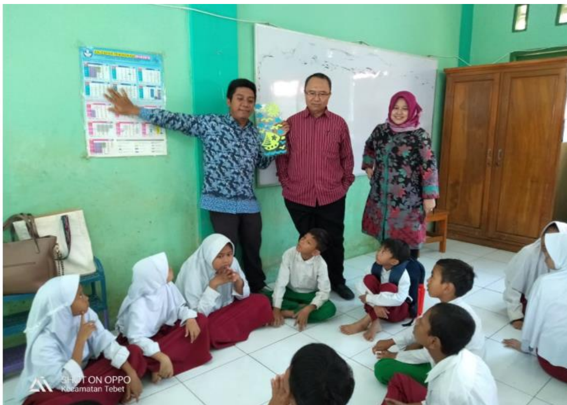
Gambar 2. Tim Pengabdian memberikan penguatan pendidikan karakter pada siswa SD Muhammadiyah 11 Tanjung Lengkong Jakarta