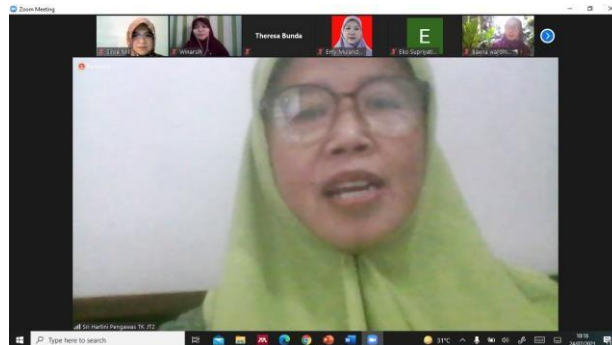
Gambar 1. Sambutan Pengawas TK Kecamatan Cipayung

kegiatan pengabdian masyarakat ini dan berharap agar kegiatan serupa dapat sering terlaksana untuk peningkatan kemampuan dan kompetensi para guru TK yang ada di gugus guru TK Binaan 03 dan Binaan 04 Kecamatan Cipayung Jakarta Timur.