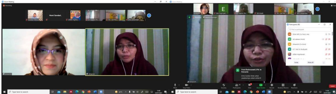
Gambar 3. Kegiatan diskusi dengan peserta

Kegiatan tanya jawab dan diskusi secara interaktif dilakukan setelah pemberian materi selesai. Pada gambar 3 moderator memimpin jalannya diskusi