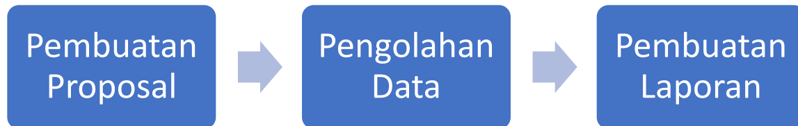
Diagram Alir Penelitian