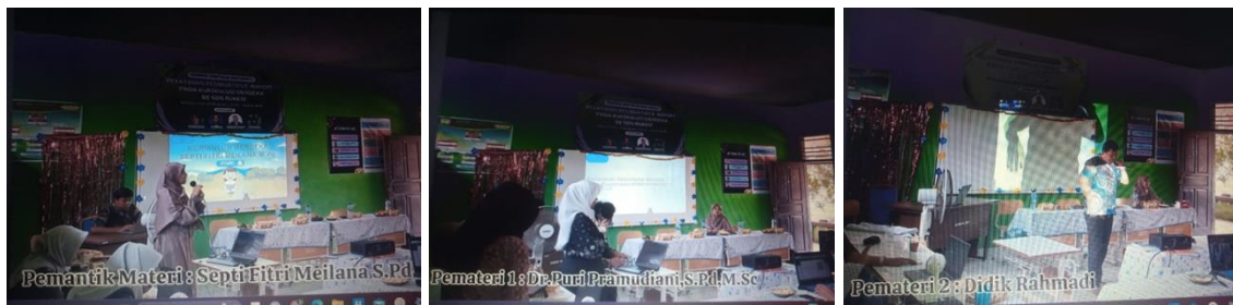
Gambar 1. Penyampaian Pemantik Materi (kiri), Pemateri 1 (tengah, Pemateri 2 (kanan)