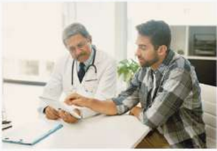
الطَّيِّبُ يَفْحَصُ المَرِيضَ