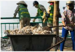
الرِّبَّالُ يَجْمَعُ القَّمَامَةَ