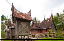
الْمَرَزَّة lumbung padi