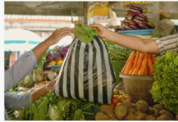
البَّائِعَةُ تَبِيعُ الخَضِرَوَاتَ