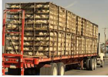
السَّيَّارَةُ تَنْقُلُ الدَّجَاجَ