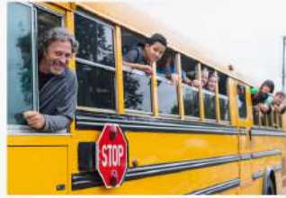
السَّائِقُ يُرَكِّبُ المَسَافِرَ