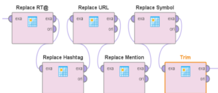
Gambar 4. Proses Data Cleansing

Data cleansing adalah proses penting dalam text preprocessing untuk analisis lebih lanjut. Dalam proses ini, data yang terkumpul akan dibersihkan dari berbagai kesalahan atau anomali yang mungkin ada. Dalam penelitian ini, data dibersihkan menggunakan suboperator di dalamnya, di mana terdapat operator replace dan trim .