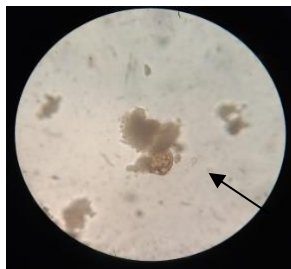
Gambar 1. Telur cacing Ascaris lumbricoides dibuahi

Dalam penelitian ini, metode yang digunakan untuk mendeteksi telur cacing Soil Transmitted Helminth (STH) adalah metode flotasi sentrifugasi yang menggunakan larutan ZnSO_4 33% dan sukrosa 33%; kemudian, sampel diamati di bawah mikroskop. Pada hasil pemeriksaan mikroskopik, diperoleh telur cacing Ascaris lumbricoides dibuahi (Gambar 1.), Ascaris lumbricoides matang (Gambar 2.) dan Ascaris lumbricoides decorticated (Gambar 3.).