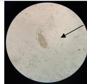
Gambar 3. Telur cacing Ascaris lumbricoides decorticated

Terdapat 35 sampel yang diidentifikasi dalam penelitian ini. Selanjutnya, dalam larutan ZnSO_4 , diperoleh 13 sampel yang positif akan telur cacing Ascaris lumbricoides dan 22 sampel yang negatif akan telur cacing; sedangkan dalam larutan sukrosa, diperoleh 1 sampel yang positif akan telur cacing Ascaris lumbricoides dan 34 sampel yang negatif akan telur cacing. Perbandingan hasil pemeriksaan sampel feses ditunjukkan dalam grafik pada Gambar 4.