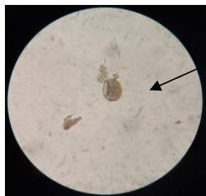
Gambar 2. Telur cacing Ascaris lumbricoides dibuahi