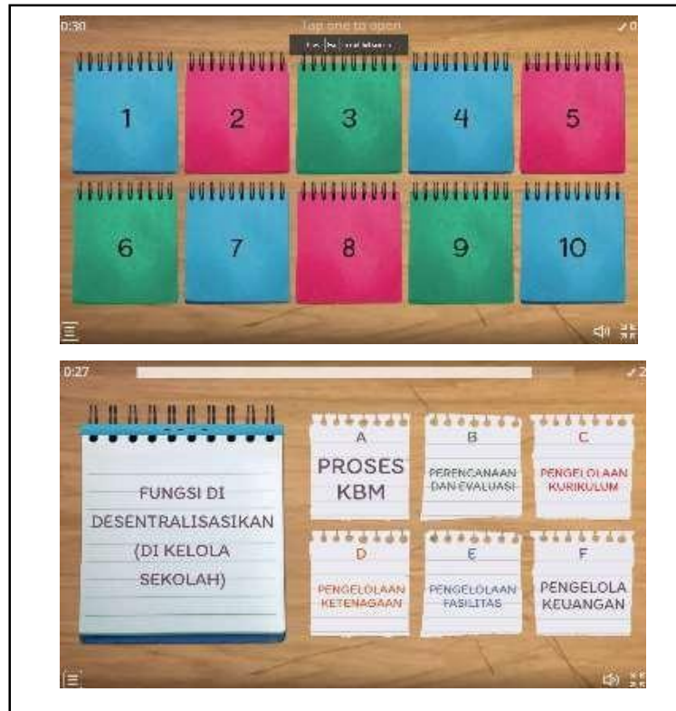
Figure 3 / Evaluasi TQM