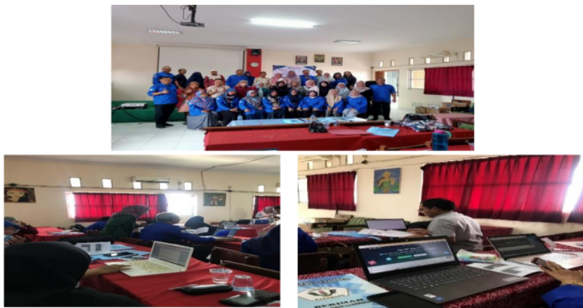
Gambar 1 Kegiatan Workshop Dan Diskusi

Kegiatan pengabdian ini meliputi beberapa tahapan di antaranya: (a) Koordinasi dengan ketua MGMP Fisika Karawang yang telah menjadi mitra untuk menentukan hari pelaksanaan pelatihan serta mendata peserta yang akan ikut; (b) Persiapan pelatihan, mempersiapkan bahan – bahan yang akan digunakan selama pelatihan; (c) Pelaksanaan pelatihan di MGMP Fisika yang bertempat di sekolah mitra yaitu SMA Negeri 4 Karawang melalui luring. Pemaparan materi ini dilakukan secara ceramah dan dilakukan tanya jawab kepada peserta pelatihan. Adanya pemaparan ini diharapkan peserta dapat mengetahui secara teoritis tentang cara membuat bahan ajar.