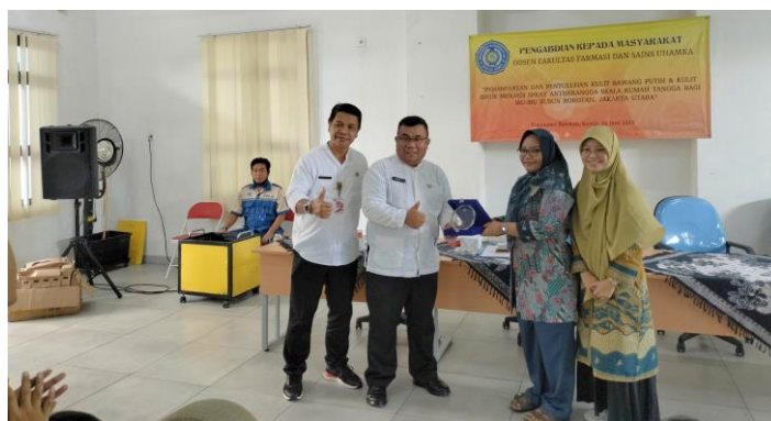
Gambar 1. Pemberian plakat kepada perwakilan UPRS III Rusunawa Rorotan

Kegiatan pengabdian masyarakat dilaksanakan pada hari Kamis, 22 Juni 2023 pada pukul 09.00 – 12.00 Wib yang berlokasi di Ruang Serbaguna Rusunawa Rorotan, Jakarta Utara. Narasumber yang memberikan materi sebanyak 2 orang dan kegiatan pembuatan spray antiserangga dipandu oleh 2 orang trainer. Peserta yang hadir sebanyak 26 orang, 4 laki-laki dan 22 perempuan. Sebagian besar peserta merupakan ibu rumah tangga. Kegiatan ini juga dibantu oleh 2 orang mahasiswa dan 7 orang staff pengelola UPRS III Rusunawa Rorotan. Kegiatan dibuka oleh perwakilan dari UPRS III yakni Kabag Keuangan dan Kasatlak Penertiban. Selanjutnya, tim pengabdian masyarakat memberikan plakat sebagai bentuk ucapan terima kasih karena UPRS III Rusunawa Rorotan bersedia menjadi mitra.