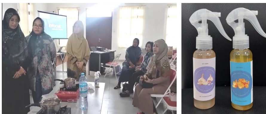
Gambar 2. Praktek pembuatan spray antiserangga dari kulit bawang putih dan kulit jeruk dan produk yang dihasilkan.

Peserta diajak untuk melakukan praktek pembuatan spray antiserangga. Adapun tahapan pembuatannya sebagai berikut: Kupas kulit bawang putih maupun kulit jeruk, bahan dipotong menjadi ukuran yang lebih kecil, bahan dimasukkan kedalam panci dan tambahkan air mineral secukupnya. Perbandingan antara bahan dengan air adalah 1:10 atau sampai bahan terendam sempurna. Proses pemanasan selama 15 menit sejak buih didih muncul. Setelah waktu habis, disaring kemudian dinginkan dan dimasukkan kedalam botol spray. Proses yang berlangsung disebut dengan metode ekstraksi infusa. Hasil yang diperoleh berupa sediaan cair yang dibuat dengan cara mengekstraksi bahan dari tumbuhan yang dipanaskan dengan air selama 15 menit pada suhu 90° C (Depkes, 2000).