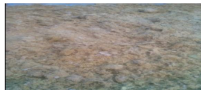
Gambar 2. Limbah Ampas Jahe