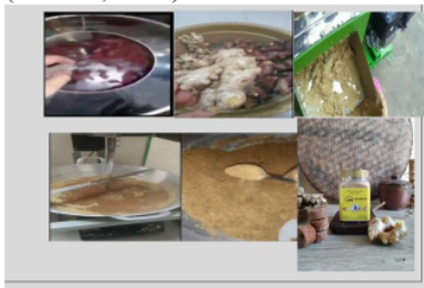
Gambar 1. Pengolahan Serbuk Jahe

Usaha mikro minuman serbuk jahe instan JM HAMKA adalah sebuah usaha yang dikembangkan secara mandiri oleh warga desa Dukuh Jeruk kecamatan Karangampel kabupaten Indramayu sebagai usaha pengembangan perekonomian warga. Kelompok usaha minuman serbuk jahe instan ini berdiri pada tahun 2018 seperti yang tertulis pada surat keterangan usaha dari desa setempat dengan nomor: 510/377 Ekbang. Selain itu kelompok usaha ini juga sudah memiliki standar kelayakan dari dinas kesehatan Indramayu dengan dikeluarkannya sertifikat PIRT nomor 2133212010767-25. Kelompok usaha ini terdiri atas 5 orang ibu rumah tangga yang menggantungkan pendapatannya hanya dari penjualan minuman serbuk jahe instan ini untuk membantu ekonomi keluarga (Pezzini, 2020).