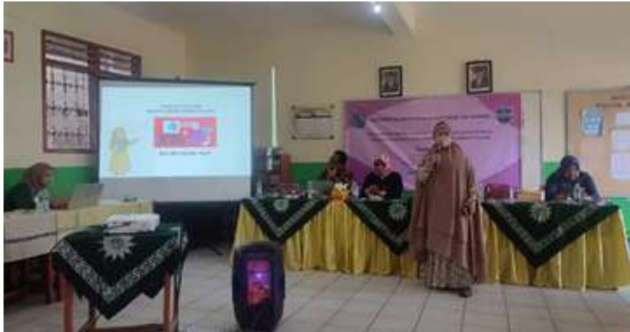
Gambar 1. Pemberian Materi secara Panel

untuk media pembelajaran yang efektif. Para guru diperkenalkan dengan YouTube Live, YouTube Studio, dan fitur kolaborasi lainnya (Dinata, 2021). Materi juga mencakup pemanfaatan kanal pendidikan di YouTube. Guru akan mendapatkan tips tentang menemukan, menyusun, dan menggunakan kanal pendidikan dalam pembelajaran bahasa Indonesia di SMP.