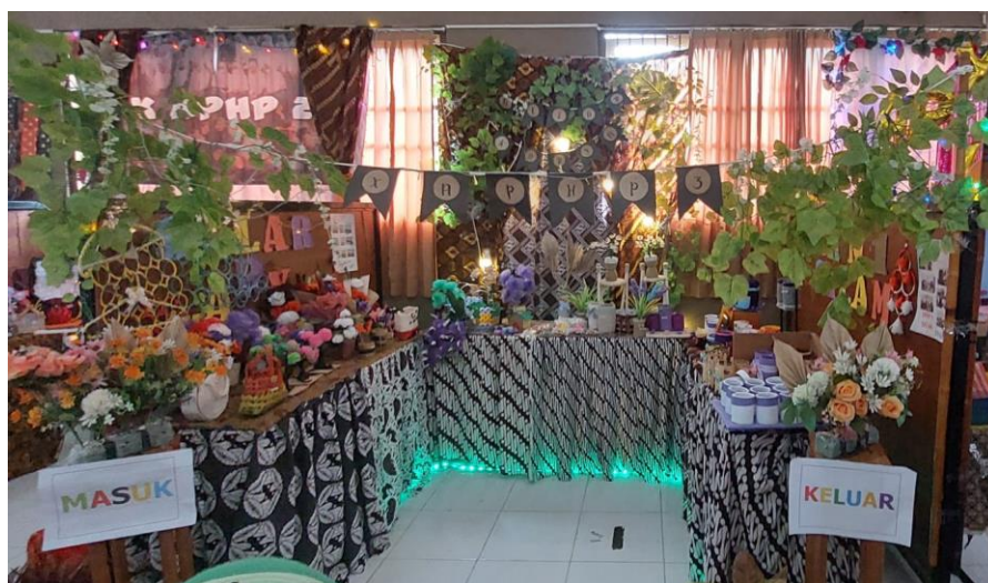
Gambar 1. Salah Satu Luaran Pembelajaran P5

Proyek penguatan profil pelajar Pancasila, sebagai salah satu sarana pencapaian profil pelajar Pancasila, memberikan kesempatan kepada peserta didik untuk mengalami pengetahuan sebagai proses penguatan karakter sekaligus kesempatan untuk belajar dari lingkungan sekitarnya. Dalam kegiatan proyek profil ini, peserta didik memiliki kesempatan untuk mempelajari tema-tema atau isu penting seperti perubahan iklim, anti radikalisme, kesehatan mental, budaya, wirausaha, teknologi, dan kehidupan berdemokrasi sehingga peserta didik dapat melakukan aksi nyata dalam menjawab isu-isu tersebut sesuai dengan tahapan belajar dan kebutuhannya. Proyek penguatan profil pelajar Pancasila diharapkan dapat menginspirasi peserta didik untuk berkontribusi bagi lingkungan sekitarnya (Rizal et al., 2022). Bagi pekerja di dunia modern, keberhasilan menjalankan proyek akan menjadi prestasi.