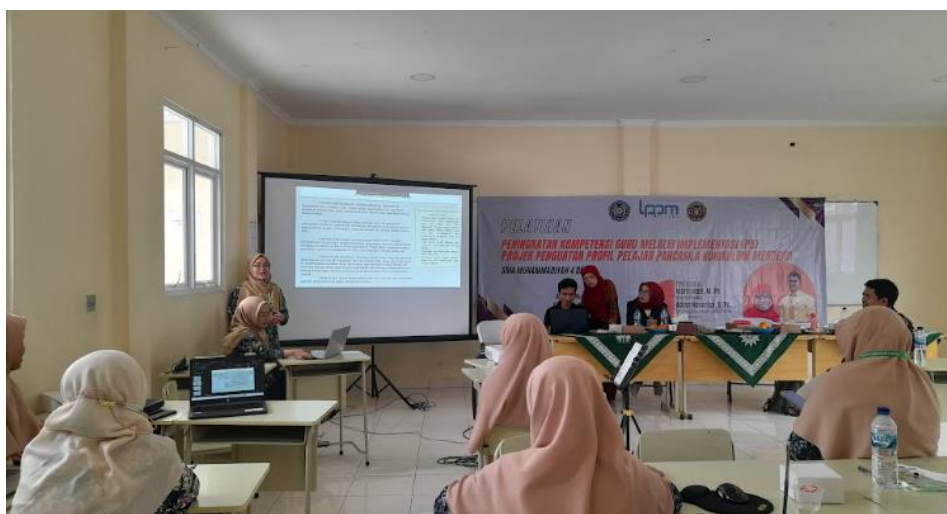
Gambar 8. Presentasi rancangan proyek P5 oleh peserta pelatihan