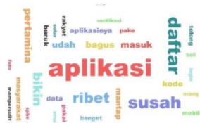
Gambar 14. Visualisasi Wordcloud

masing-masing memiliki jumlah 160, 155, dan 140 kata.