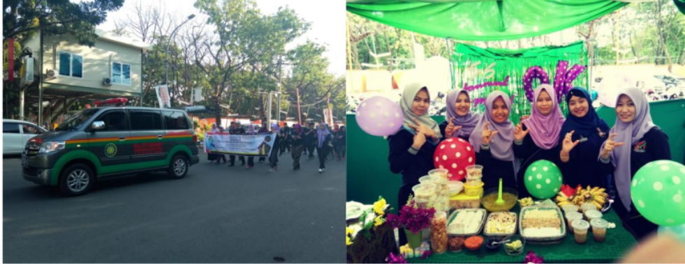
Gambar 3. Penggerakan Masyarakat (Jalan santai dan Bazar Makanan Sehat) di RS Sitti Khadijah I Makassar

yang menasar ibu hamil dan menyusui, pasien dan keluarga TB serta masyarakat umum dimana hal tersebut didasarkan pada pokok permasalahan di masing-masing rumah sakit.