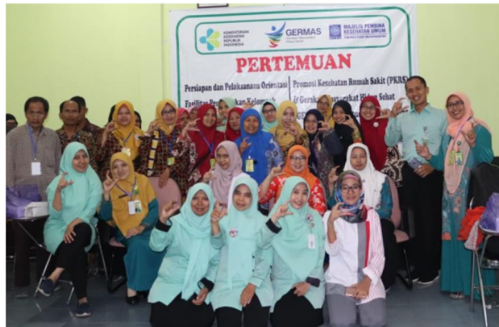
Gambar 2. Orientasi Kader Kesehatan dan Tim PKRS Rumah Sakit di Rumah Sakit Muhammadiyah Sruweng