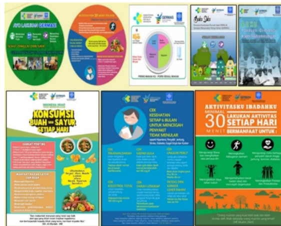
Gambar 1. Media Promosi Kesehatan Gernas Berkemajuan MPKU PP Muhammadiyah Tahun 2018

dengan 5 Direktorat Promosi Kesehatan dan Pemberdayaan Masyarakat Kemenkes RI.